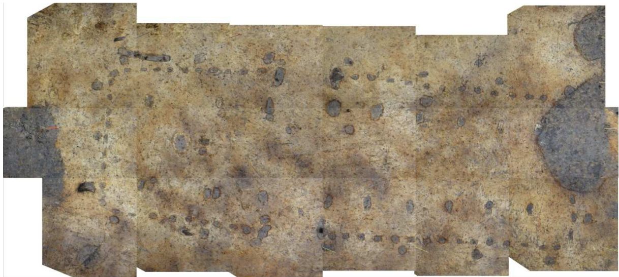
Afb. 3: fotogrammetrische weergave huisplattegrond Ruinen (IJzertijd)

Als vierde moet worden genoemd dat de software niet alleen ontworpen is als een digitale versie van het bestaande documentatiesysteem voor archeologische opgravingen, maar ook als een onderdeel van procesontwikkeling. De software kan leiden tot verbeterde werkwijzen en is dan ook voortdurend in ontwikkeling. Bij elke grote opgraving komen we weer nieuwe zaken tegen die verbeteringen in de